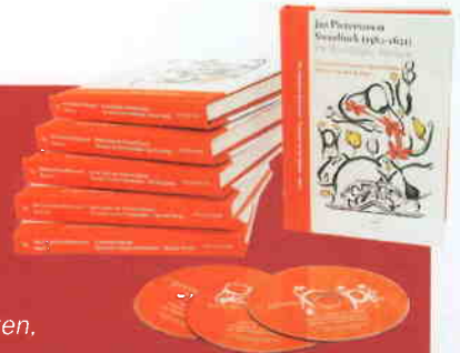
Gesualdo Consort Amsterdam

Deel II: De Psalmen Davids, Deel II A: Eerste Boek der Psalmen Davids, Glossa GES 922402 (3 cd's); Deel II B: Tweede Boek der Psalmen Davids, Glossa GES 922403 (3 cd's); Deel II C: Derde Boek der Psalmen Davids, Glossa GES 922404 (3 cd's); Deel II D: Vierde Boek der Psalmen Davids, Glossa GES 922405 (3 cd's); Deel III: De Cantiones Sacrae, Glossa GES 922406 (2 cd's)