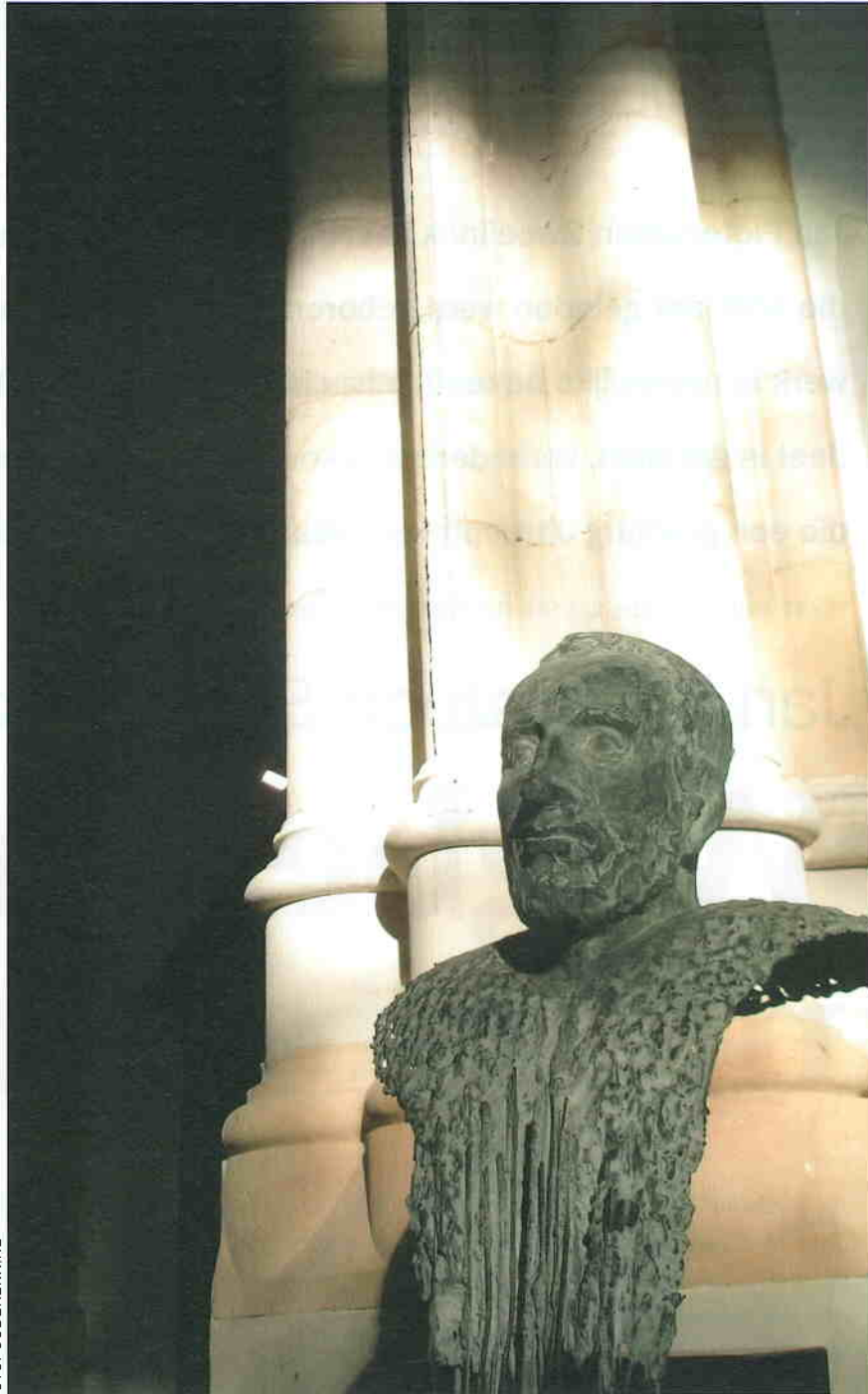
De vernietigde buste van Sweelinck

man die ook nog eens briljant kon improviseren op het klavecimbel. Vele bekende volksliedjes uit die tijd verhief hij tot een set met ingenieuze variaties zoals Mein junges Leben hat ein End , Est-ce Mars? en Ik voer al over Rhijn .